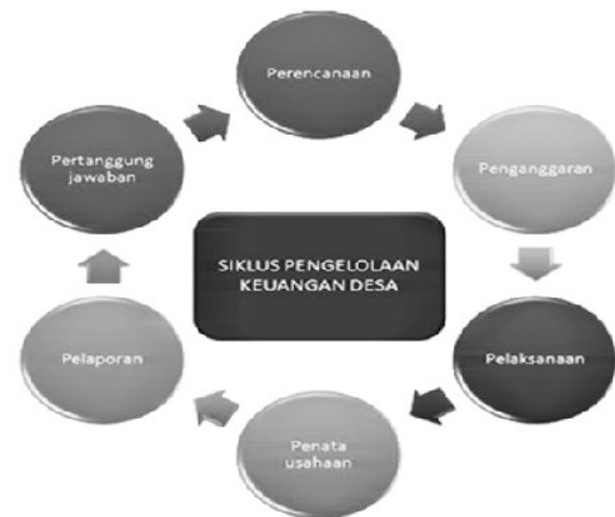
Gambar 1. Siklus Keuangan Desa

(biasanya 1 tahun yg disebut APBDes). Anggaran Pendapatan dan Belanja Desa, selanjutnya disingkat APBDes adalah rencana keuangan tahunan pemerintahan desa yang dibahas dan disetujui bersama oleh pemerintah desa dan Badan Permasyarakatan Desa, dan ditetapkan dengan peraturan desa.